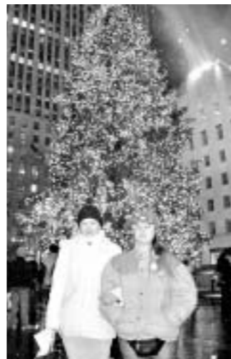
Dvije zvezdice, obje Maje, uz najveći bor u New Yorku ispred Rockefellerova centra